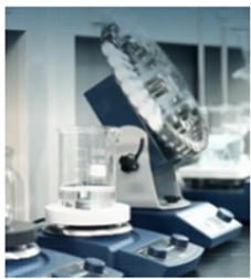
EQUIPOS BÁSICOS LABORATORIO