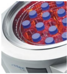
AUTOCLAVES Y PREPARADORES MEDIOS